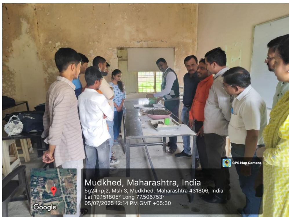
Students and Teachers attentively participated in hands on workshop on seed ball making.